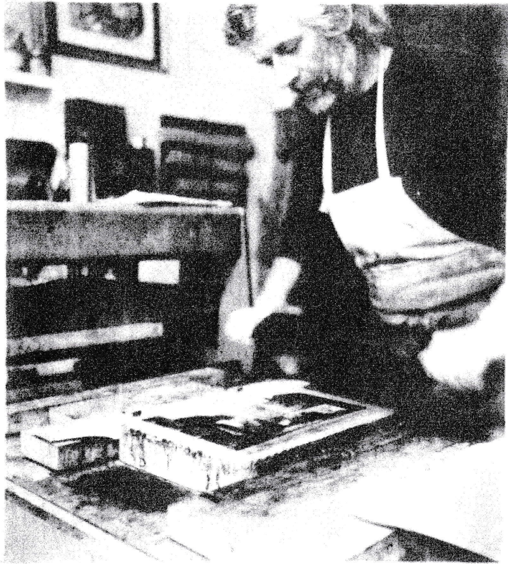
"Der Drucker" Bromöldruck 1998 Torsten Grüne