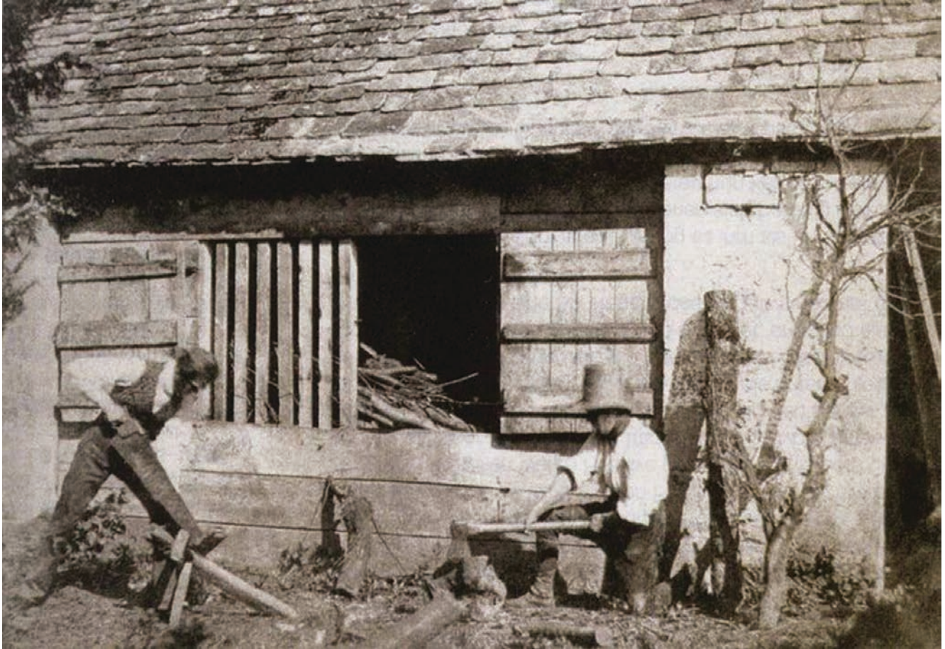
Salzdruck: William Henry Fox Talbot 1842/43 „Schreiner in Lacock“