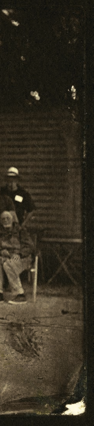
Rechts oben: Salzdruck: Hubert Redelberger, Ruine.