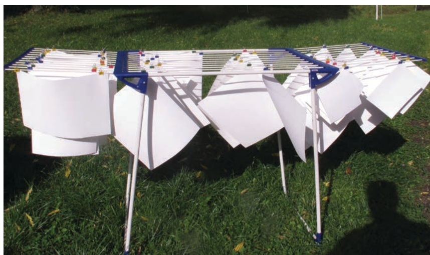
Gesalzene Papier trocknen.

Zum Salzen des Papiers, was bei Licht durchgeführt werden kann, ist dieses ca. eine Minute in die Salzlösung zu legen, dann diesen Vorgang mit wenden des Papiers viermal wiederholen, sodass das Papier ca. fünf Minuten in der Flüssigkeit verbleibt. Danach das Papier, z. B. mit „Maul Original Mauly Klemmer“, an einer Wäscheleine oder am Wäscheständer aufhängen und ca. 24 Stunden lang trocknen. Die gesalzene Papiere sind unbegrenzt haltbar, sodass ein Vorrat angelegt werden kann.