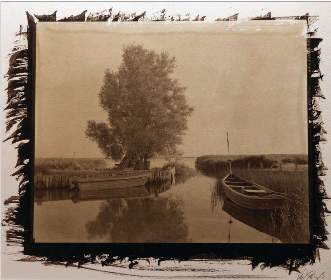
Links: Salzdruck vom 8x10 inch-Nega- tiv: Klaus-Peter Gnaß, Hafen Zempin, Usedom.